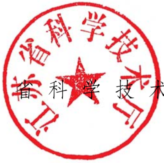
江苏省科学技术厅