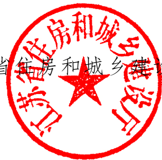
江苏省住房和城乡建设厅