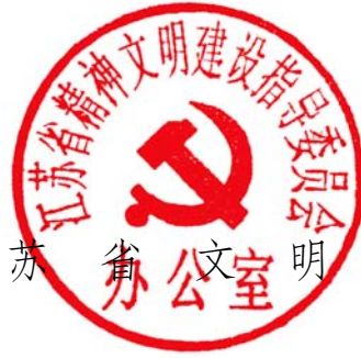
江苏省精神文明办