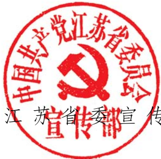
中共江苏省委宣传部