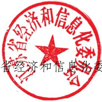
江苏省经济和信息化委员会